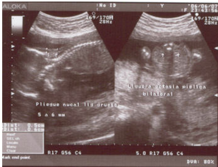
Foto No. 1 Pliegue Nucal de 5-6mm y ectasia piélica bilateral ligera