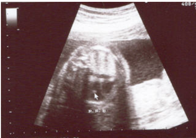
Foto No. 4 Ping-Pong-Ball