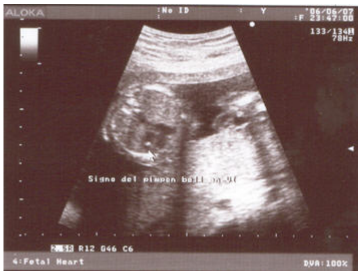
Foto No. 2 Ping-Pong-Ball