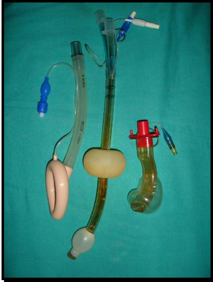
Figura-1. De Izquierda a derecha Máscara Laringea Clásica, Combitubo, Cánula COPA.